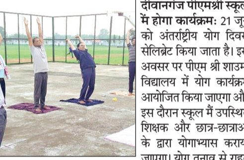
दीवानगंज पीएमश्री स्कूल में होगा कार्यक्रम: 21 जून को अंतर्राष्ट्रीय योग दिवस सेलिब्रेट किया जाता है। इस अवसर पर पीएम श्री शाउमा विद्यालय में योग कार्यक्रम आयोजित किया जाएगा और इस दौरान स्कूल में उपस्थित शिक्षक और छात्र-छात्राओं के द्वारा योगाभ्यास कराया जाएगा। योग तनाव से राहत पाने के लिए योग सबसे अच्छे समाधानों में से एक है। योग ना सिर्फ शारीरिक बल्कि मानसिक रूप से भी स्वस्थ रहने का एक बेहद ही आसान तरीका है। योग शांति प्राप्त करने में मदद करता है।

हरिभूमि न्यूज़ | रायसेन जिला खेल परिसर में आयोजित होगा अंतर्राष्ट्रीय योग दिवस पर कार्यक्रमरायसेन। जिले में ग्राहवें अंतर्राष्ट्रीय योग दिवस 21 जून को विश्व योग दिवस का आयोजन जिला खेल परिसर रायसेन में आयोजित किया गया है। जिसमें जिला मुख्यालय की समस्त शासकीय और अशासकीय संस्थाओं के छात्र-छात्राओं, गणमान्य नागरिक, जनप्रतिनिधियों एवं आमजन द्वारा सहभागिता की जाएगी। जिला स्तरीय सामूहिक योग कार्यक्रम जिला खेल स्टेडियम में सुबह 6 बजे 8 बजे तक होगा। विश्व योग दिवस 21 जून को बारिश होने की स्थिति में डाइट परिसर रायसेन में सामूहिक योग कार्यक्रम आयोजित किया जाएगा।