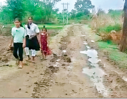
यह लोग पक्की सड़क तक भी नहीं पहुंच पाते हैं। जबकि मध्यप्रदेश में प्रधानमंत्री सड़क योजना और मुख्यमंत्री सड़क योजना चालू है इसके बावजूद भी 2 किलोमीटर की सड़क नहीं बनाई जा रही है अगर

नरखेड़ा पंचायत में आने वाला गांव खेड़ा के ग्रामीण कई वर्षों से सड़क नहीं बनने के कारण परेशान हो रहे हैं। ग्रामीणों का कहना है कि कई बार ग्राम पंचायत और सांची ब्लॉक में इस सड़क को बनाने के लिए आला अधिकाधिकारियों को आवेदन कर चुके हैं सीएम हेल्पलाइन पर शिकायत दर्ज करा चुके हैं इसके बाद भी कोई भी अधिकारी खेड़ा गांव की तरफ ध्यान नहीं दे रहा है। बारिश के समय खेड़ा गांव के लोगों का पक्के मार्ग तक आना मुश्किल हो जाता है यह लोग 4 महीने का राशन बारिश के पहले ही लेकर अपने घरों में रख लेते हैं क्योंकि बारिश हो जाने के कारण