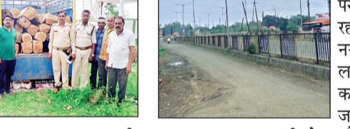
में सागौन लट्टा 23 नग 1.988 घ.मी. कीमत 1,70,414.00 रुपये की अवैध परिवहन करते हुये जप्त किया गया। जिसे आरोपी सागौन को पिकअप में प्याज की भरी बोरियों से छिपा कर ले जा रहे थे।